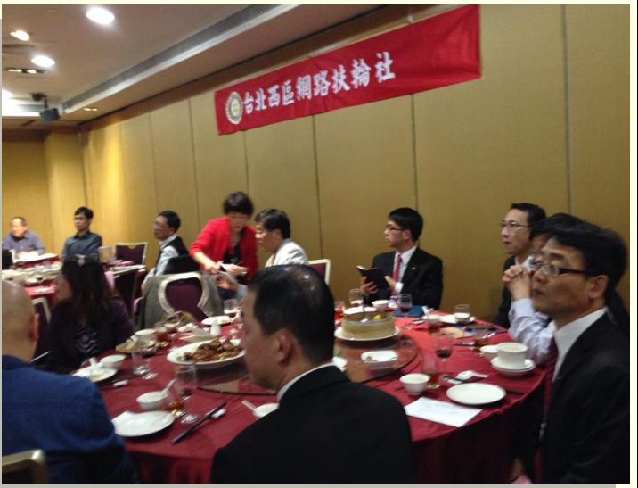
6. 今日也為本月生日的社友慶生。