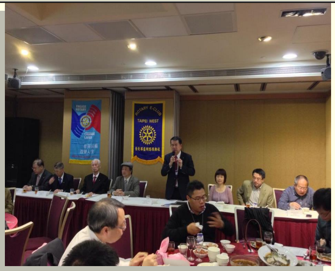
5. 相當吸引人的演講，看表情就知道！