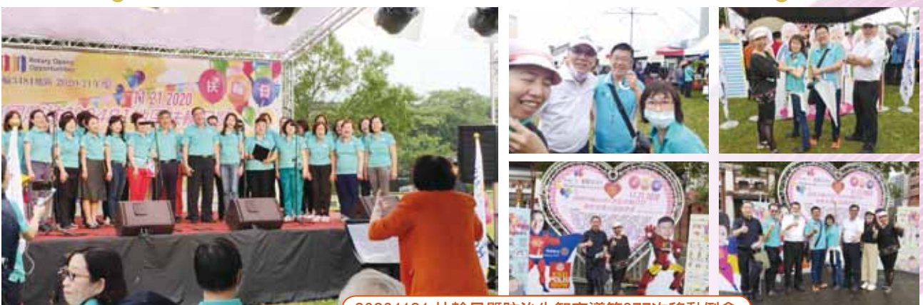
20201121 扶輪日暨防治失智宣導第377次移動例會