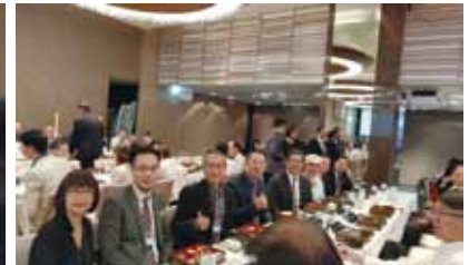
20201030 西區社及輔導子社聯合例會