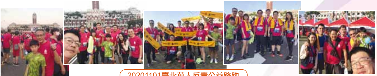
20201101 臺北萬人反毒公益路跑