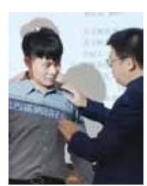
20201205 第379次實體例會(社員大會)