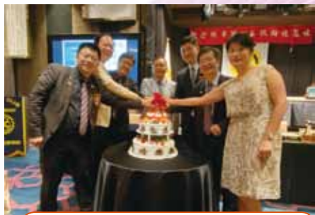
20200805 西區母社慶祝父親節