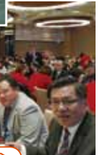
20201007 第二&八分區聯合例會第370次例會