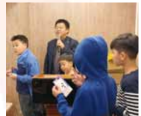
20210216 第388次實體例會(年終尾牙)