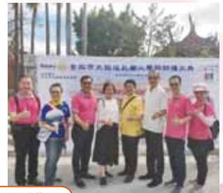
20200822 大稻埕孔廟拜師禮