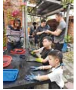
20210327 三峽一日遊扶輪家庭聯誼